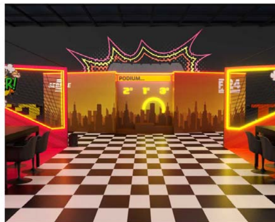
Imagem 3D SEM ESC.