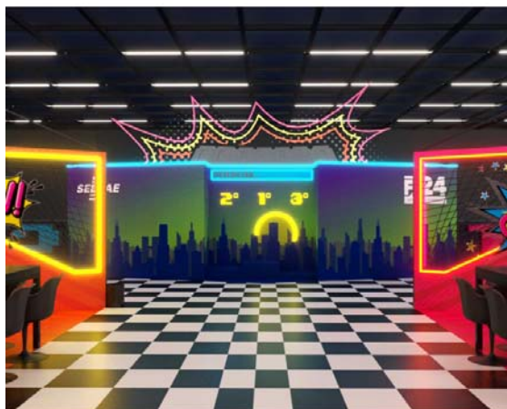
Imagem 3D SEM ESC.