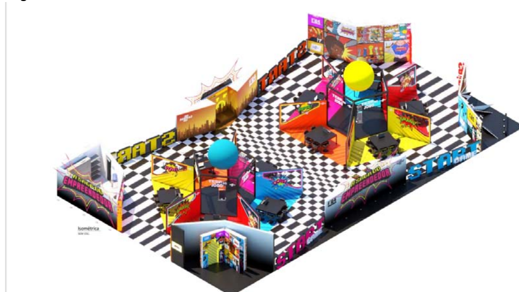
Isométrica SEM ESC.